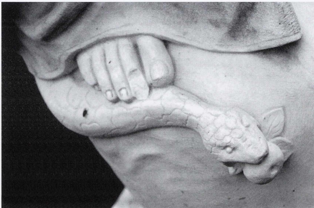
Figiúr 9: An Mhaighean Muire ina seasamh ar nathair