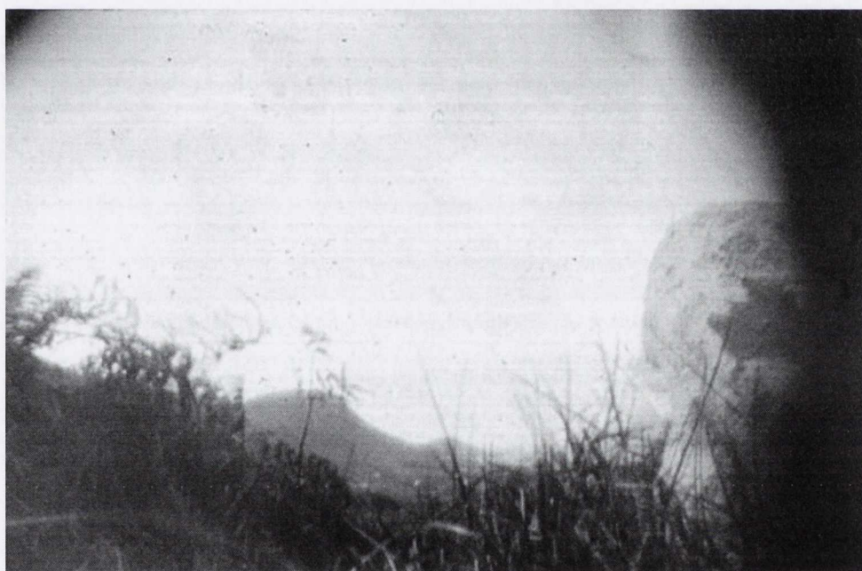
Figiúr 11: Ón taispeántas Glórtha ón gCillín

Faoi dheireadh ‘Liombó 2’, tá mé an dáin ábalta amharc ar an chillín mar a bheadh ‘tearmann’ ann chomh maith, cé gur défhiúsaí go mór an dán é. Tá cosúlacht le sonrú arís idir ‘barróg ghlas’ 508 Ní Mhóráin agus ‘luí faoi sciatháin leamhan’ Jenkinson sa mhéid is go mbíonn siad beirt ag fágáil chúram na leanaí faoin dúlra. Níos minice ná a mhalairt, áfach, is ar ghnéithe doicheallacha na háite a chuireann siad beirt béim, agus go háirithe an dorchadas a mhacallaíonn Liombó féin: ‘contráth oíche’, ‘cliabh na hoíche’, ‘coim na hoíche’, ‘idir dhul fé is éirí gréine,’ 509 ‘faobhar nó dorchadas na hoíche.’ 510