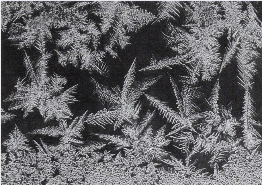
Figiúr 6: Bláth Seaca

Aisteach go leor, i ndiaidh di a rá gur coinníodh slán ón ghealtacht ghlan í, luaitear dhá chomhartha sho-aitheanta sóirt de chuid na gealtachta sa chéad rann eile, mar atá rogha Shuibhne de chrann agus de bhia. Luaitear freisin go bhfuil ‘bláth seaca’ ar a súile (34), íomháineas as an ghnáth a mheabhraíonn, b’fhéidir, tábhacht na gcrann. Seo an rud is bláth seaca nó fern frost ann: