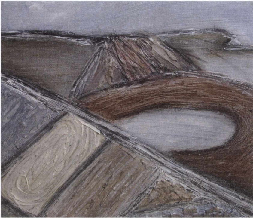
Figiúr 4:the healing of Mis I: linne a' leighis le Déirdre Ní Mhathúna (2013)

Fianaise faoina brúidiúlacht agus a heaspa daonnachta atá ina salachar i scéalta na dtaistealaithe chomh maith. Tá sé le tuiscint nach duine mar is ceart í toisc nach dtugann sí aird ar a corp. Ina ionad sin, ligeann sí d'ainmhithe cónaí 'sa mhothar dubh faoina hascaillí', agus déanann neamhaird den fhuil mhíosta 'a thiteann uaithi ina drisíní' (M 2-3). Léiríonn na taistealaithe, leis, tábhacht phraiticiúil an ghlanta i gcomhphobal ar bith: 'a bréantas ar an ngaoith a leathann fiabhras' (M 3).