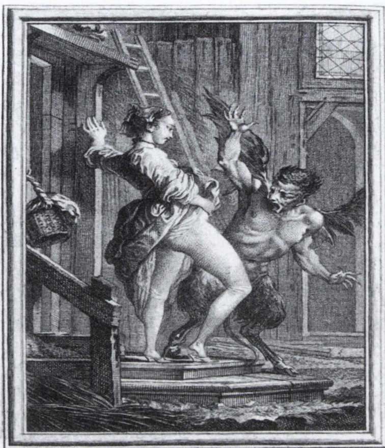
Figiúr 8: Sampla d'anasyrma le Charles Eisen (1896)