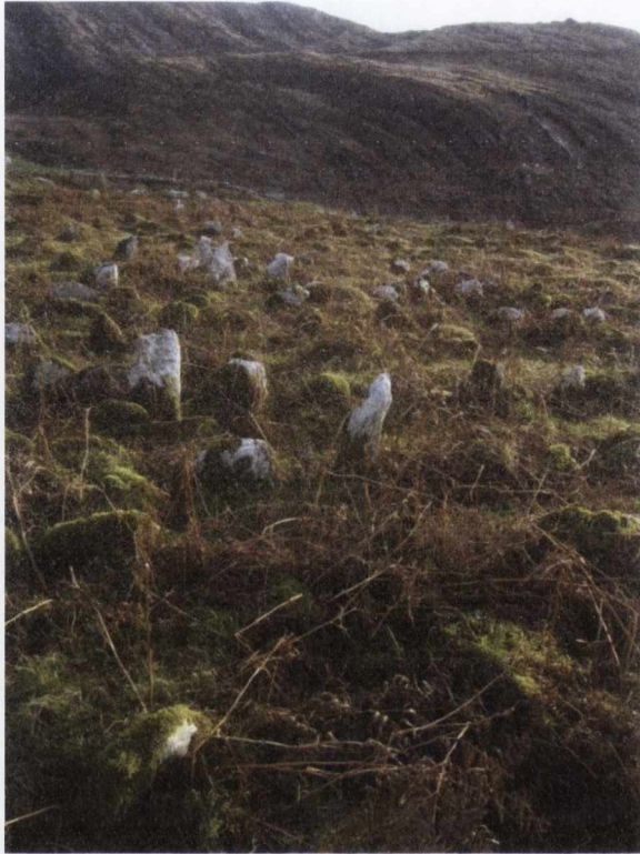
Figiúr 10: Cillín in Uíbh Ráthach a bhfuil os cionn 100 leacht cuimhneacháin ann

Is é seo croí na faidhbe. Ní dhéantar idirdhealú coirp ná anama idir leanbh na máthar seo agus gach leanbh neamhnite eile. Seachas uaigh chinnte a bheith ag a leanbh agus a anam a bheith slán, macallaíonn teibíocht na ceallúraí imeallacht Liombó 498 agus teibíocht a cailliúna: