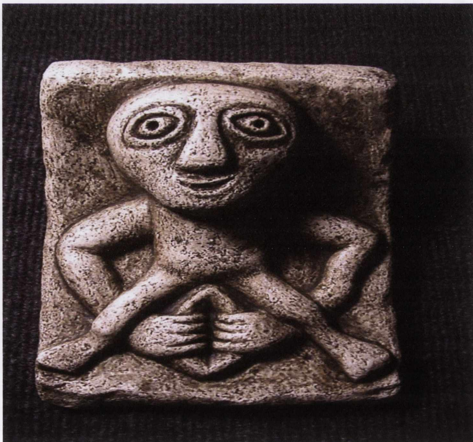
Figiúr 7: Síle na gCíoch

Is éard, go baileach, is Síle na gCíoch ann ná snoiteán cloiche d’fhíor nocht bhaineann agus béim faoi leith ar a pit ollmhór, a bhíonn á taispeáint go gáifeach aici mar a fheictear thíos. Bíonn cuma shean ar an chuid uachtarach dá corp – í maol, roic uirthi uaireanta, a cuid cíoch ar liobarna agus a cuid easnacha le feiceáil go soiléir go minic.