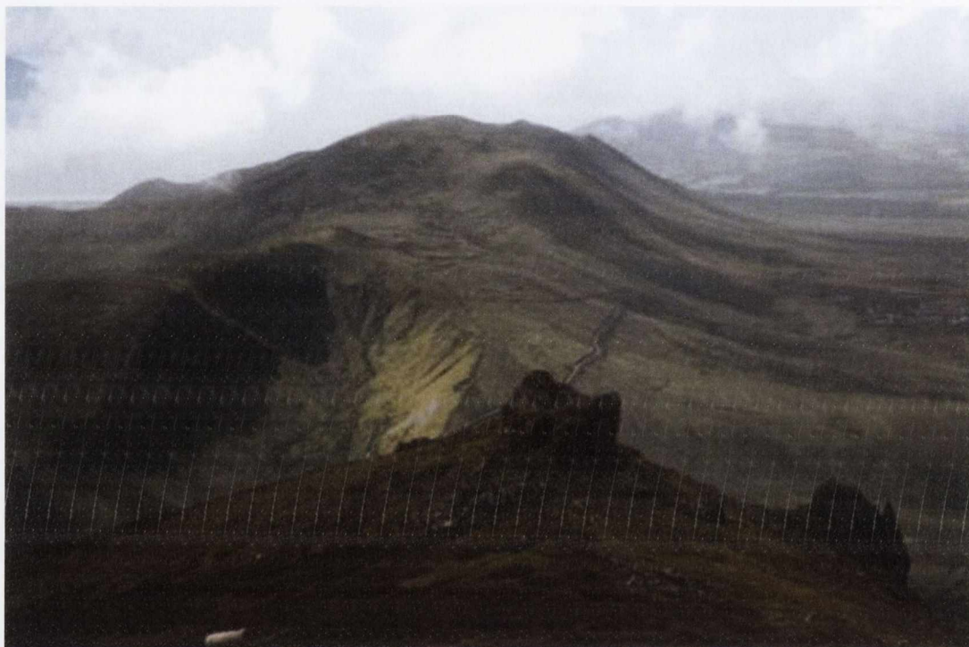
Figiúr 5: Radharc sceirdiúil ó bharr Shliabh Mis ( mountainviews.ie )