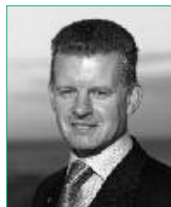
An tAire Stáit Trevor Sargent, T.D., (freagrach as Bia agus Gortóireacht)