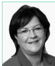
An tAire Stáit Máire de Bhaillís T.D., (freagrach as an bhForaoiseacht)